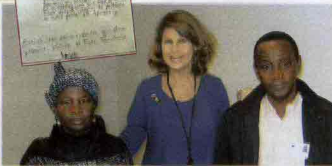
Qui sopra: Limane Koita e Diamany Tounkara con l'eurodeputata Silvia Costa, a Bruxelles. A sinistra: i genitori di Yaguine e Fodé nel 1999. Nell'altra pagina: giovani manifestano per i due ragazzi.